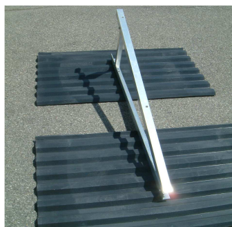
Příklad montáže podpěry Profi

Jedna podpěra pro plochou střechu Profi podél na dvou deskách se vzhledem k horší boční stabilitě nedoporučuje.