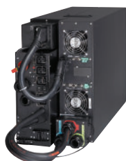
UPS 9PX 11 kVA s údržbovým bypassem