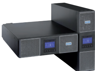
Universální provedení rack / tower