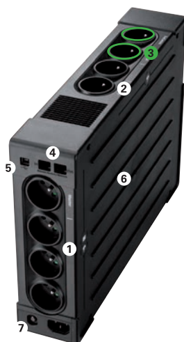
Eaton Ellipse PRO 1600