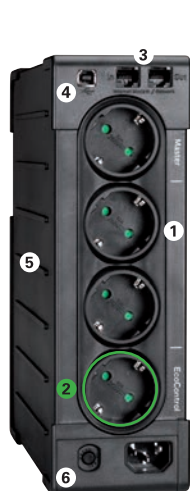
Eaton Ellipse PRO 650