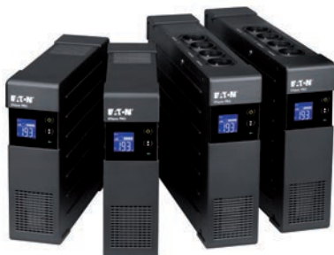
Produktová řada Ellipse Pro